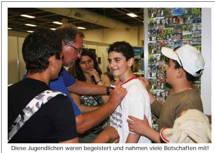
Diese Jugendlichen waren begeistert und nahmen viele Botschaften mit!

Selbstvertrauen stärken, Perspektiven eröffnen. Eine letzte Chance für die, die es wirklich wollen.