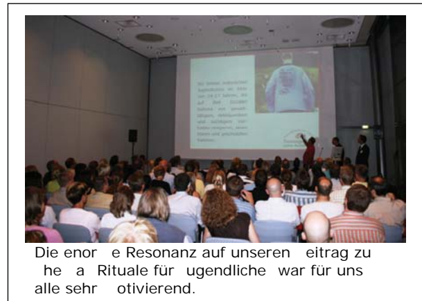
Die enorme Resonanz auf unseren Beitrag zu heiligen Ritualen für Jugendliche war für uns alle sehr motivierend.

Die Respekttrainer waren begeistert von den vielen