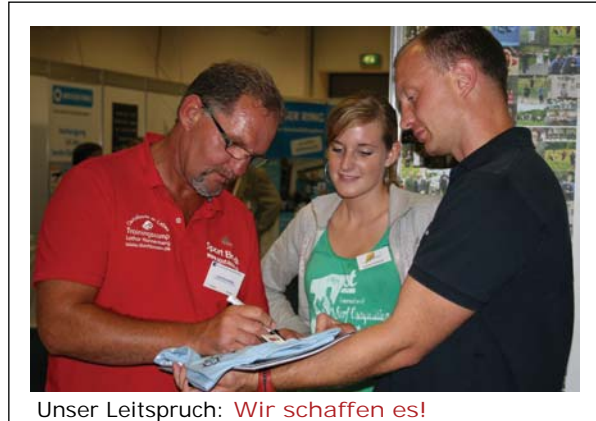
Unser Leitspruch: Wir schaffen es!

Der hohe Anspruch unserer Arbeit kann nur in einer Atmosphäre gelebt werden, in der sich Jugendliche und Erwachsene wohl fühlen. Konsequenz ist ebenso wichtig wie Liebe, Wärme und Geborgenheit. Ziel ist, den Jugendlichen eine positive, autonome Lebensgestaltung zu ermöglichen.